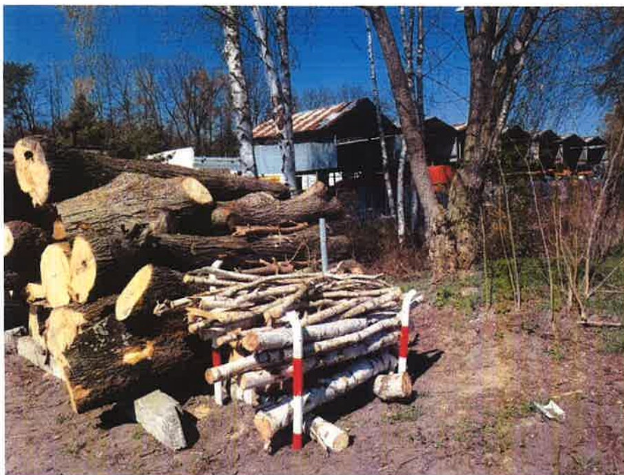
Drewno średniowymiarowe – zdjęcie stosu nr 14