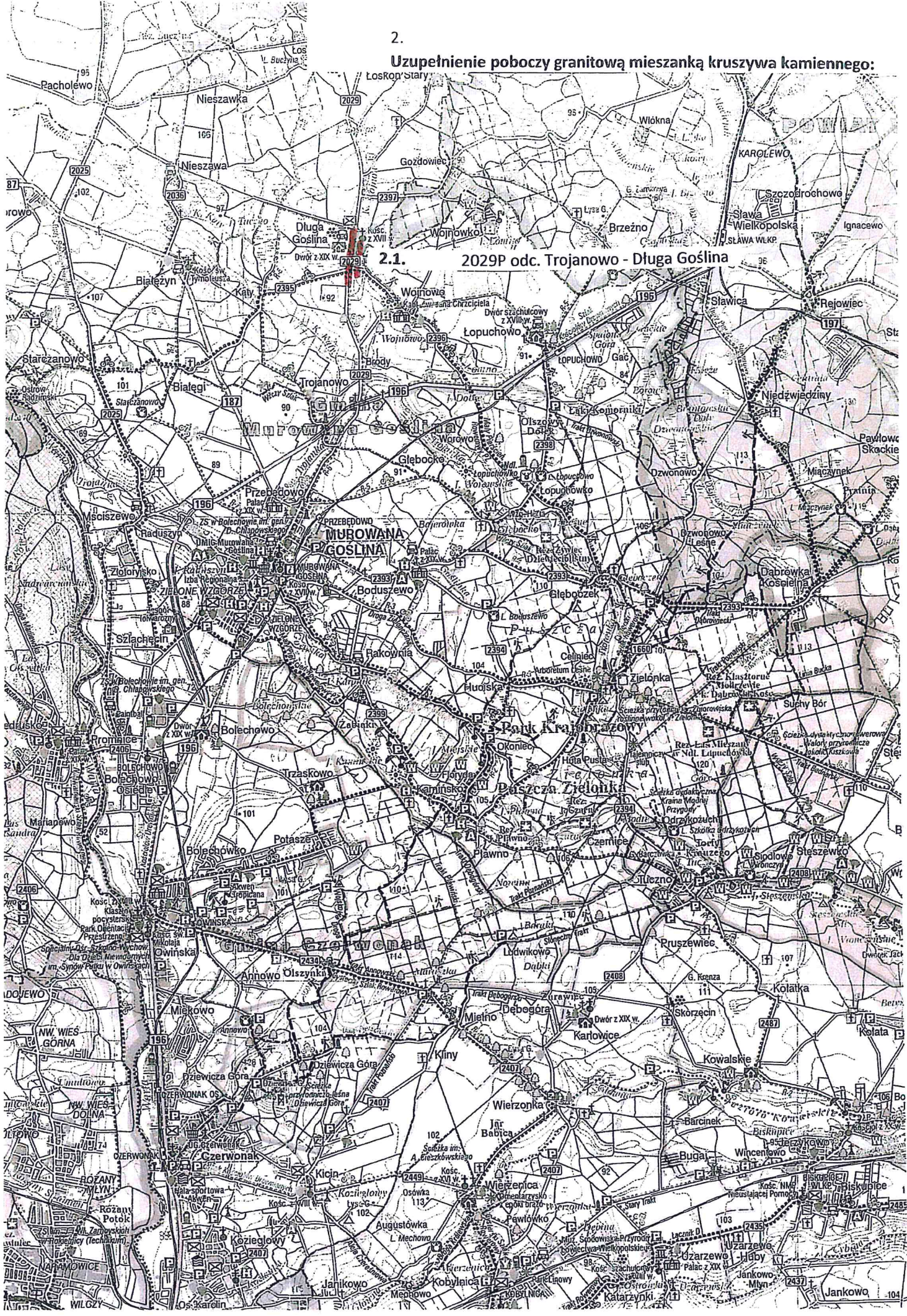
2.1. 2029P odc. Trojanowo - Długa Góslina